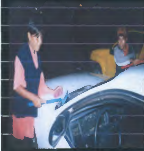
NIÑOS TRABAJADORES DE LA CALLE