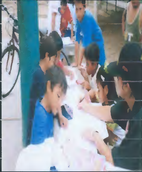
TALLER DE PINTURA